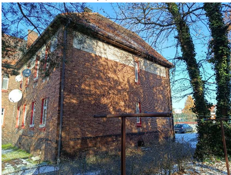
Fot. 2. Elewacja południowo-wschodnia.