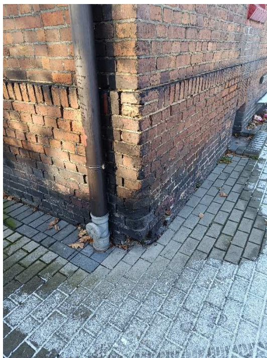
Fot. 7. Wyflukane cegły – narożnik południowy.