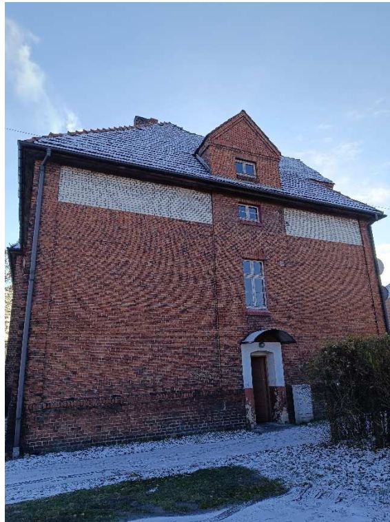
Fot. 4. Elewacja północno-zachodnia.