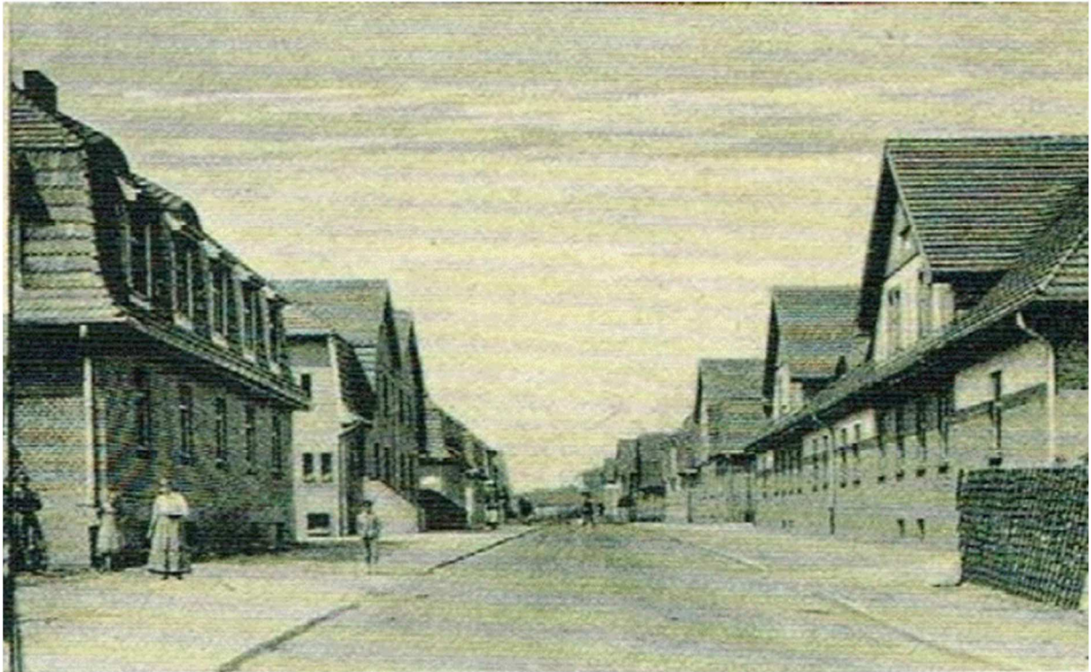
Rys. 2. Widok na ul. Wolności, fragment pocztówki „Czerwionka-Leszczyń na dawnych pocztówkach, planach i mapach.