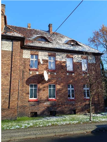
Fot. 9. Różnorodność okien.