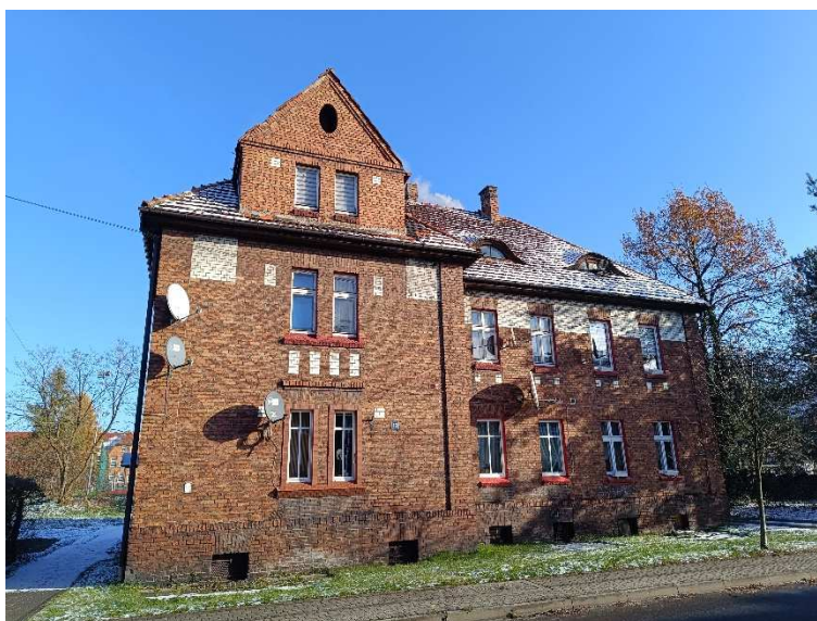
Fot. 1. Elewacja południowo-zachodnia.