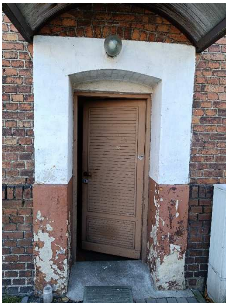
Fot. 11. Drzwi wejściowe do klatki I.

Oświetlanie nad wejściem zmienione – przewidziane do wymiany.