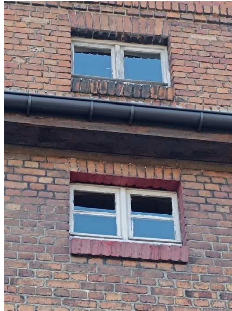
Fot. 10. Przemalowane parapety.