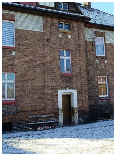
Fot. 12. Drzwi wejściowe do klatki II.