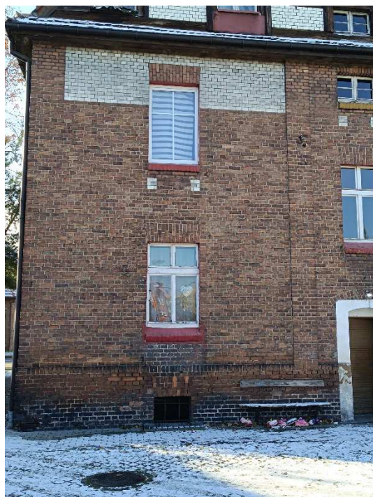
Fot. 8. Różnocoowane okna, kolory parapetów, występujące kraty w oknach piwnicznych.