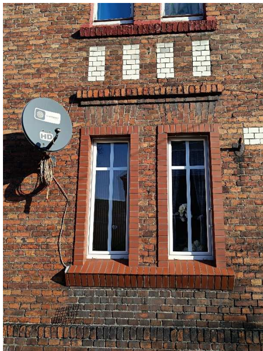
Fot. 5. Wykonane opaski wokół okieni obudowane parapety.