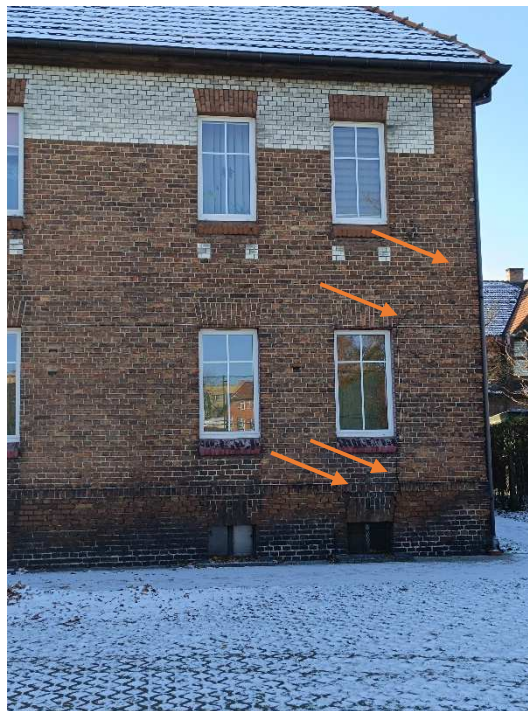
Fot. 6. Elewacja tylna – znaczne pęknięcia w murze.