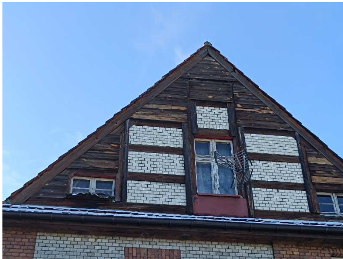
Fot. 13. Mur pruski w ryzalicie od strony północno-wschodniej.

Całość konstrukcji jest spękana i odbarwiona, z widocznymi większymi i mniejszymi wypróchnieniami, miejscowo brakuje mocujących kołków. W niektórych oknach brak parapetów.